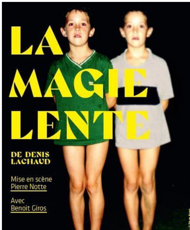
La Magie lente de Denis Lachaud

Texte paru aux Editions Actes Sud-Papier Mise en scène Pierre Notte Interprétation Benoit Giros Lumières Éric Schoenzetter Régie Alexandre Mange Costume Sarah Leterrier Production L'Idée du Nord